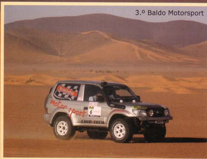
3.º Baldo Motorsport